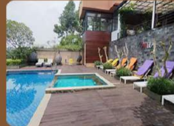
Villa Canella - Nongkojajar

@hfcyouthprox INFO & REGISTRATION KAK NANDA 0813 3337 9388