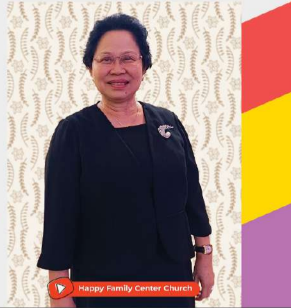
Happy Family Center Church

GEREJA HAPPY FAMILY CENTER KOTA Jln. Taman AIS Nasution no 35