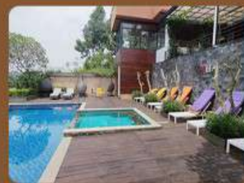
Villa Canella - Nongkojajar