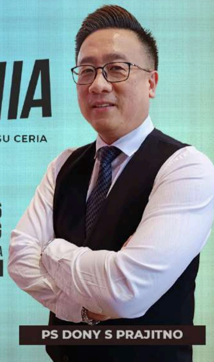
PS DONY S PRAJITNO

GEREJA HAPPY FAMILY CENTER KOTA TAMAN AIS NASUTION NO 35