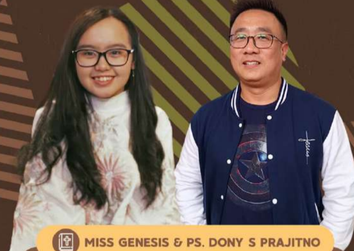
MISS GENESIS & PS. DONY S PRAJITNO